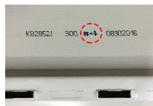
# de planche

* Il est important d'y porter une attention particulière et de procéder à l'installation des planches de façon aléatoire afin d'optimiser l'effet bois. Ne jamais reproduire la même séquence de pose pour éviter de créer un effet tapisserie.