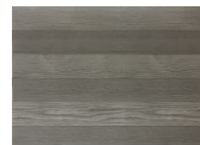
6 planches | 6 nuances