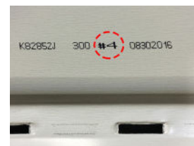
# de planche

* Il est important d'y porter une attention particulière et de procéder à l'installation des planches de façon aléatoire afin d'optimiser l'effet bois. Ne jamais reproduire la même séquence de pose pour éviter de créer un effet tapisserie.