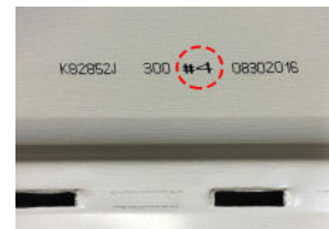
# de planche

* Il est important d'y porter une attention particulière et de procéder à l'installation des planches de façon aléatoire afin d'optimiser l'effet bois. Ne jamais reproduire la même séquence de pose pour éviter de créer un effet tapisserie.