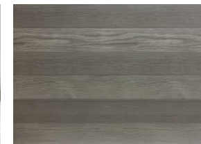
6 planches | 6 nuances