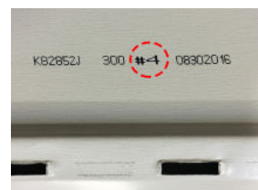
# de planche

* Il est important d'y porter une attention particulière et de procéder à l'installation des planches de façon aléatoire afin d'optimiser l'effet bois. Ne jamais reproduire la même séquence de pose pour éviter de créer un effet tapisserie.